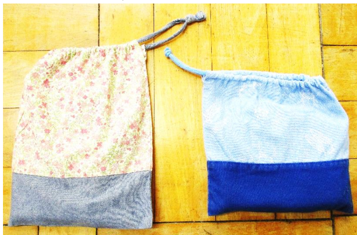
・ランチョンマット入れ